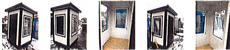
Budka wartownicza, portiernia, stróżówka, kontener